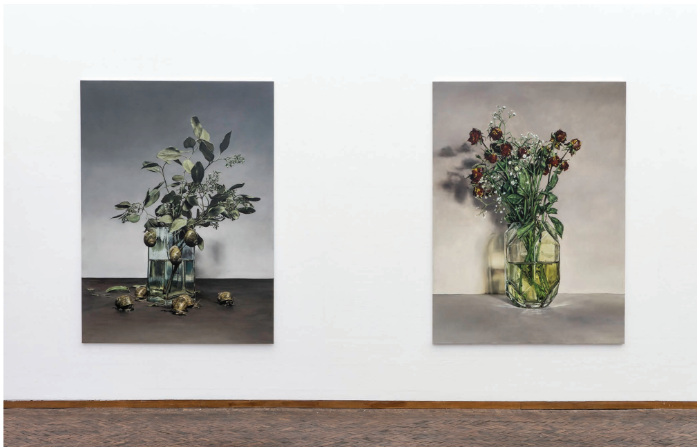
Vue de l'exposition Reigns de Damien Cadio, 2019, galerie Gerhard Hofland, Amsterdam.

Damien Cadio est un peintre aux tonalités sourdes et aux ambiances profondes. Partant souvent des images du quotidien, la peinture devient une entreprise du déplacement, de décentrement, par laquelle chaque chose se charge d'un poids inconnu. « Je cherche des images a priori banales – car encore une fois la violence n'est jamais loin – et l'attention à leurs détails fait surgir d'un environnement simple les indices d'événements extraordinaires ». Léa Bismuth, janvier 2012.