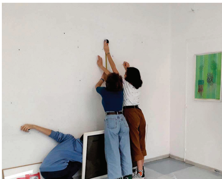
Séance d'accrochage au collège du Loroux Bottereau