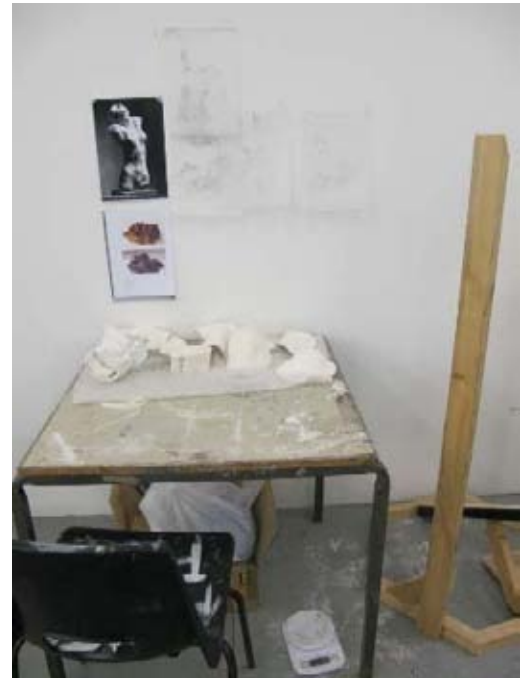
Ateliers des étudiants BA Fine ART