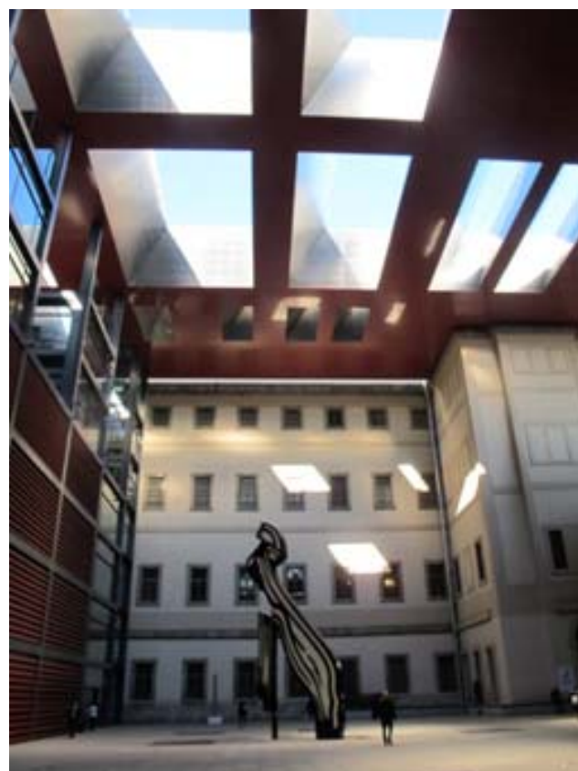
Museo Nacional Centro de arte Reina Sofia