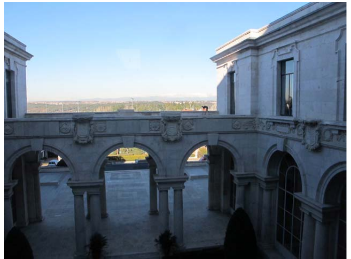
Casa de Velázquez