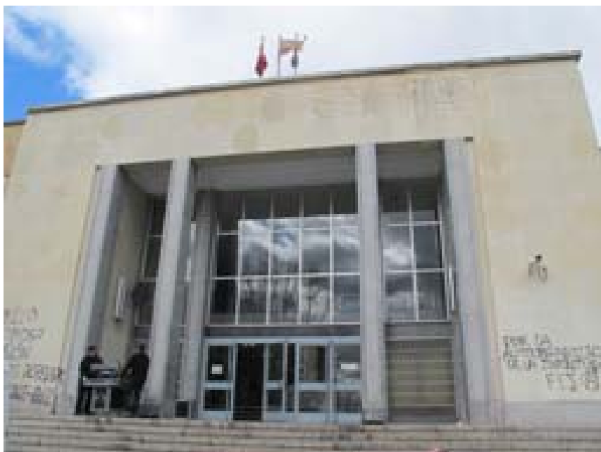
Facultad de Bellas artes