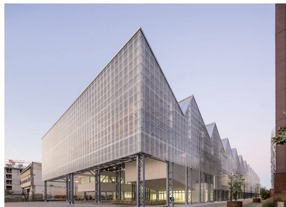
Architecture Franklin Azzi.

Que sont-ils devenus après une école d'art ? Présentation du parcours de quelques alumni, discussions et témoignages des anciens étudiants à propos de leurs itinéraires professionnels et artistiques après l'école.