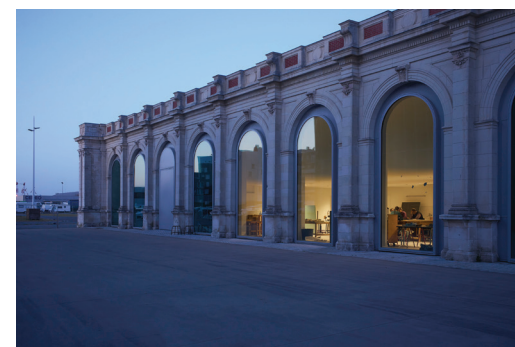
Site de Saint-Nazaire – Architecture Titan.