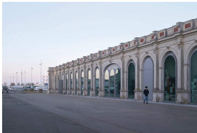
en haut : Vues d'ateliers des étudiants, Saint-Nazaire.

Possibilité de bourses sur critères d'excellence.