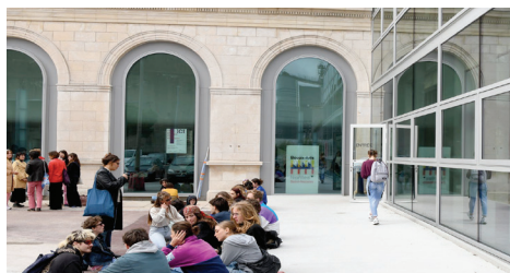
Site de Saint-Nazaire. Inauguration 15/11/2022 Architecture Titan, Nantes.