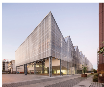
Site de Nantes. Ouvert depuis septembre 2017 Architecture Franklin Azzi, 2017.

Les Beaux-Arts Nantes Saint-Nazaire sont situés au cœur d'un territoire culturel et artistique exceptionnel avec de nombreux musées, galeries et centres d'art, et à seulement deux heures en train de Paris.