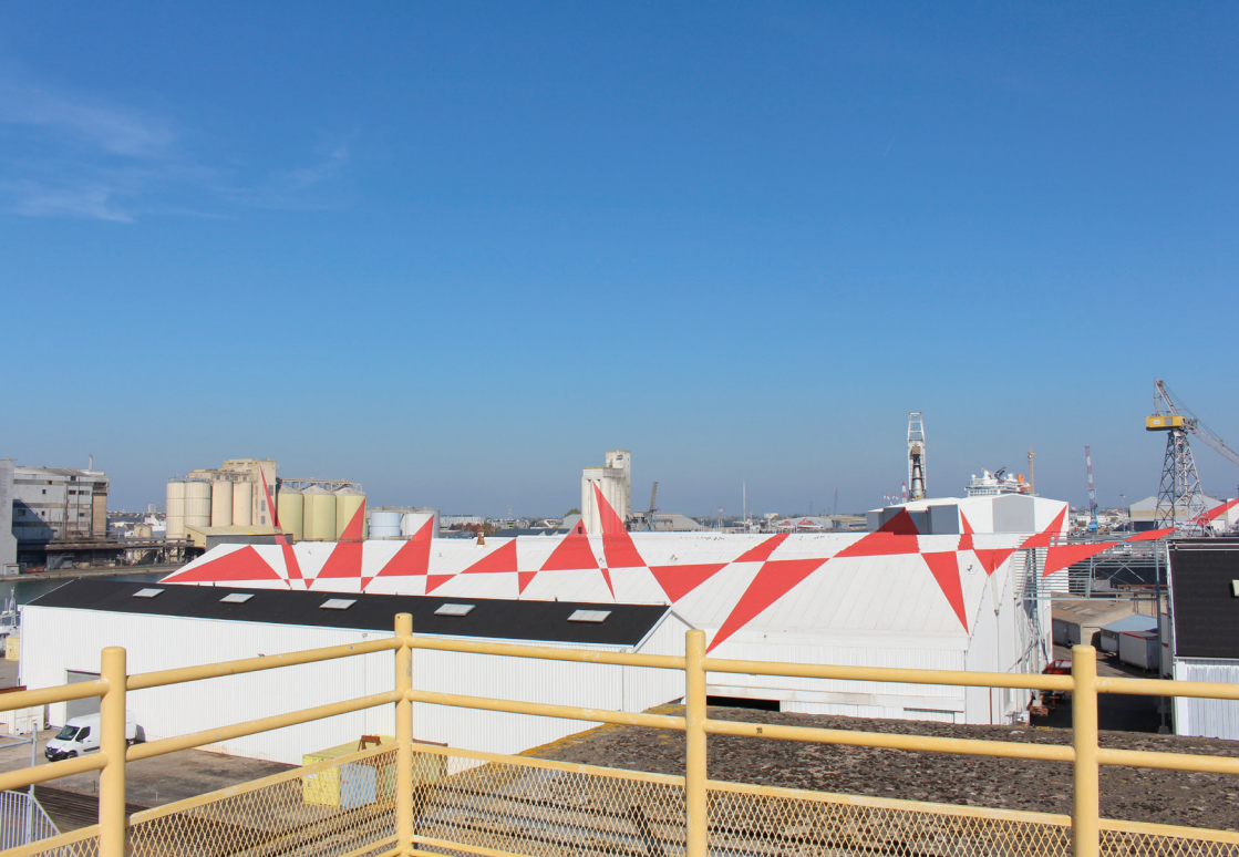
Felice Varini, Suite de triangles , 2007, Saint-Nazaire