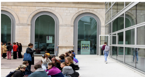
Site de Saint-Nazaire. Inauguration 15/11/2022 Architecture Titan, Nantes.