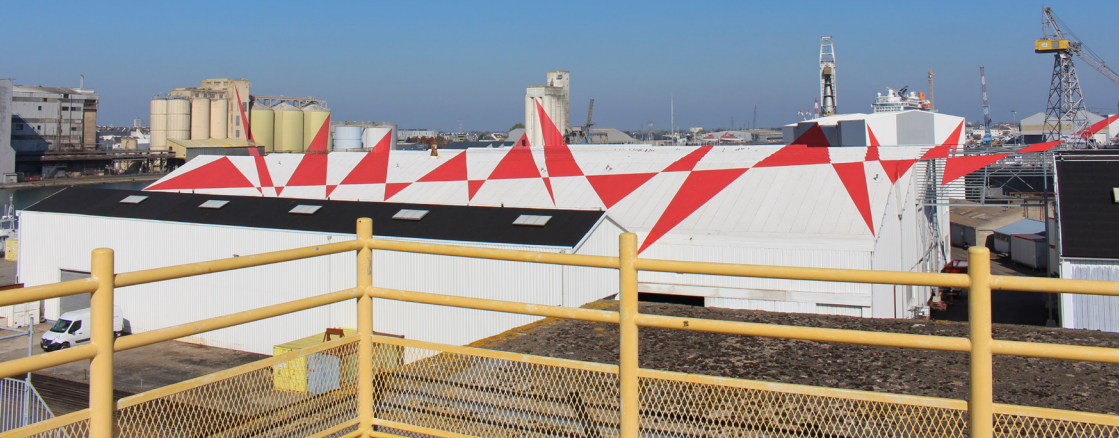
Felice Varini, Suite de triangles , 2007, Saint-Nazaire