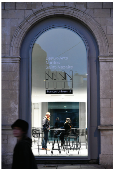
à gauche : Site de Saint-Nazaire. Architecture Titan, Nantes. Photo Martin Launay, Ville de Saint-Nazaire, 2022 ci-dessous : intérieur 1 er étage. Photo Mai Tran ci-dessous : Workshop sur la plage, Saint-Nazaire Photo Beaux-Arts Nantes Saint-Nazaire, 2020