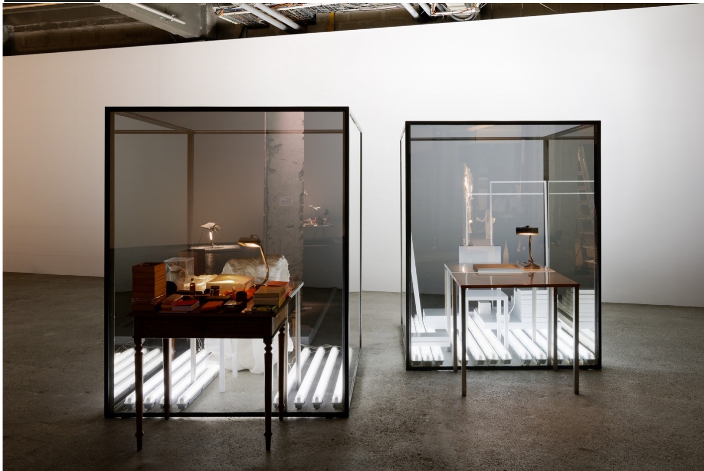
Laura Lamiel, Chambres de capture (vous les entendez ?) , 2015, acier, miroir espion (verre sans tain), tables (bois, cuivre, acier), brique en acier émaillé, cuir, objet de la collection de l'artiste, 190 x 200 x 160 cm.