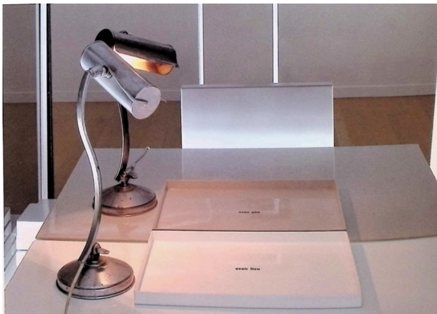
Laura Lamiel, Chambres de capture (vous les entendez ?), détails.