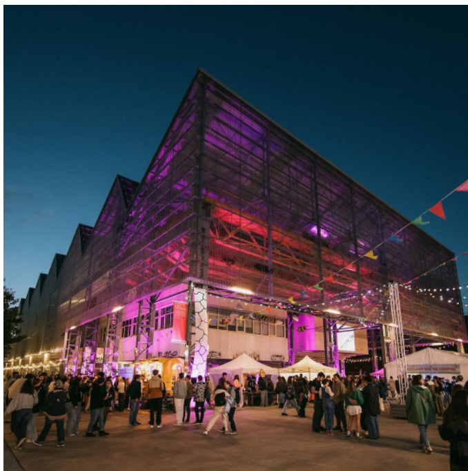
Festival de rentrée Nantes Université 2024