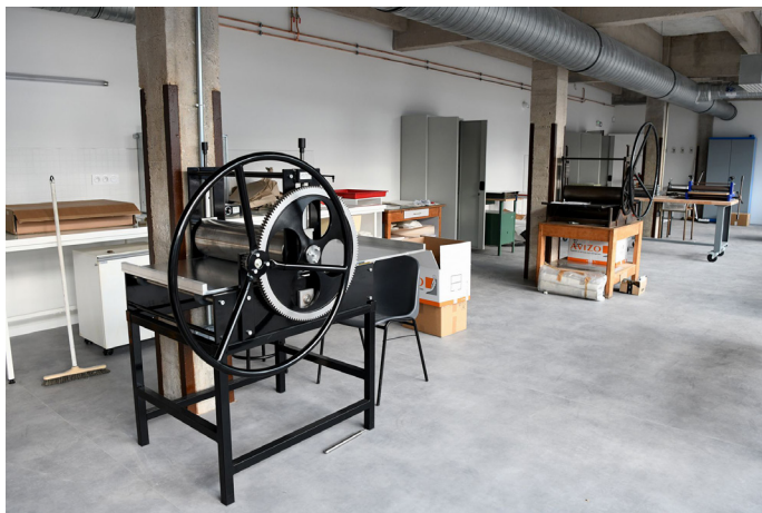
ci-dessus : Centre de documentation et atelier d'impressions