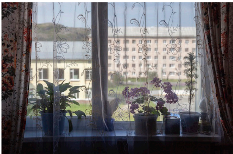
SEMAINE 2 Extrait de la série The Northern Sea Route © Ruth Maclennan

Le projet dessine une cartographie d'espaces intimes propres au confinement et rassemble une communauté de femmes artistes confrontées au même défi de toujours devoir faire de l'art.