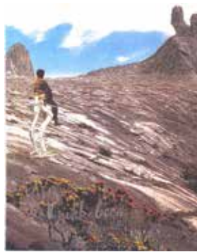
Panamarenko Knikkebeen , 1998 Technique mixte 57,7 x 45,7 cm