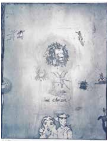
Anne-Laure Sacriste Que choisir , 1995 Eau forte aquatinte 35 x 42 cm