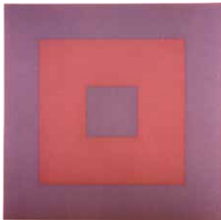
Aurélie Nemours ALBIREO , 1981 Sérigraphie 52 x 52 cm (encadrée)