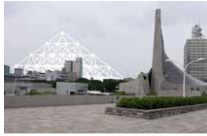
Benoît Broisat Ghost Tokyo (Try 2004) , 2013 Photographie (Tirage pigmentaire) 50 x 60 cm