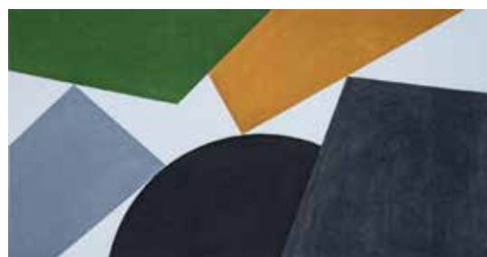
David Tremlett Creel #2 , 2009 Digigraphie sur Arches digital 63 x 109 cm