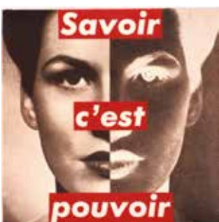
Barbara Kruger Sans titre, 1989 Sérigraphie 91,5 x 109,8 cm