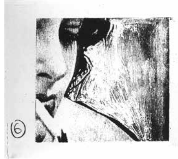
Claude Buraglio Elle fume pour dix , 1993 Lithographie 65 x 50 cm