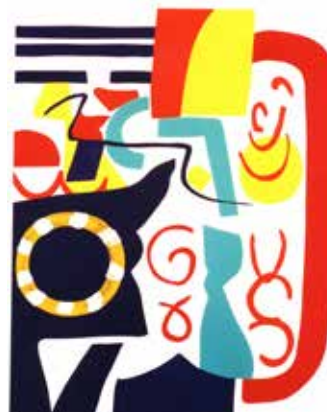
Shirley Jaffe Sans titre, 1996 Sérigraphie 56 x 76 cm