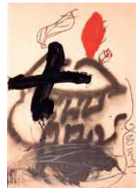
Tapiès 200 Anys , 1989 Lithographie 90 x 63 cm