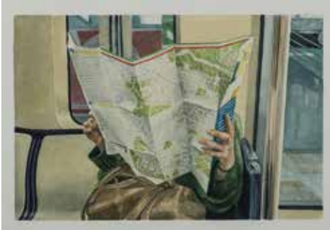
Briac Le Prêtre Plan , 2012 56,5 x 77 cm