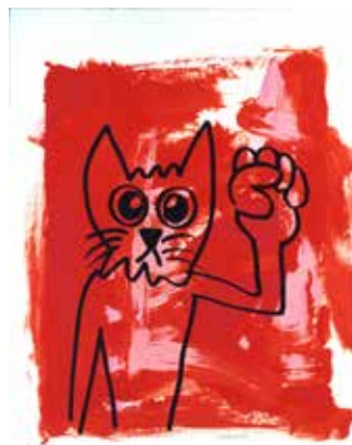
Alain Séchas Sans titre, 1996 Sérigraphie 75 x 105 cm