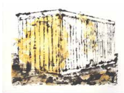
Philippe Cognée Sans titre, 1996 Lithographie 56 x 76 cm