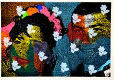
Ghada Amer Sans titre, 1996 Sérigraphie 75 X 105 cm (encadrée)